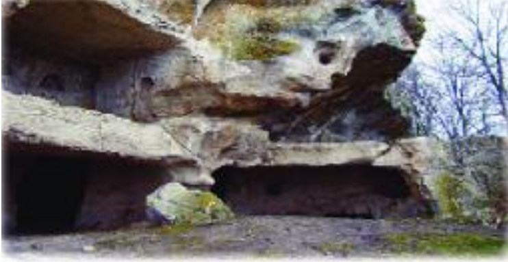
URL 1: Mağara yerleşim alanı (Kırım)

Yerleşme; insanların barındıkları, ekonomik ve sosyal faaliyetlerini sürdürdükleri yeri ifade eder. İnsanlar tarih boyunca sürdürdükleri faaliyetlere ve doğal çevreye bağlı çeşitli yerleşmeler kurmuşlardır. İhtiyaçlarını doğadan avcılık ve toplayıcılık yaparak sağlayan ilk insanlar da doğanın etkilerinden korunmak için yerleşme yeri olarak mağaralar ve ağaç kovuklarını seçmişlerdir.